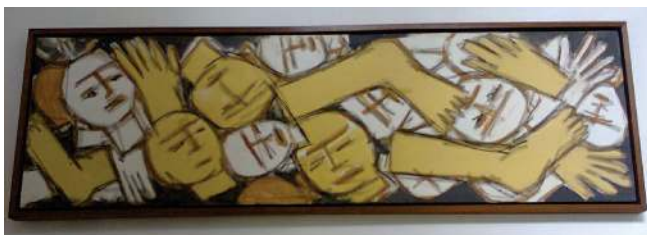
Figura 4. Quadro da artista plástica Ana Veloso com o tema ex-voto, onde se encontram varias imagens representando cabeças e membros.