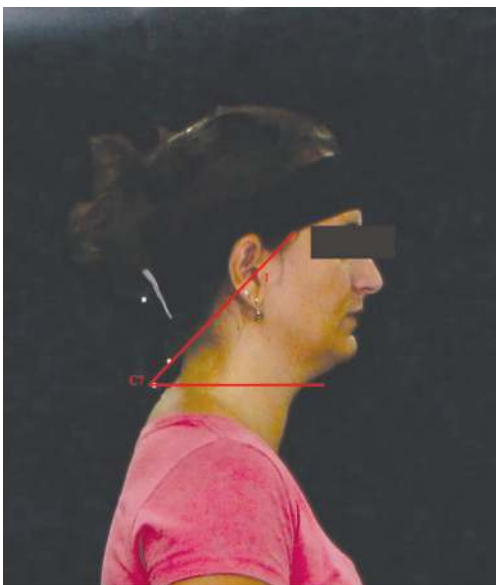
Figura 1 – Mensuração do ângulo crânio-cervical. O traçado é realizado a partir de uma linha horizontal passando por C7 e outra ligando o trágus.