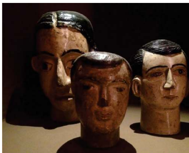
Figura 2. Ex-votos cefálicos anônimos esculpido em madeira. Exposição no Museu do homem do Nordeste-Fundação Joaquim Nabuco, Recife, Brasil.

Quando o ex-voto é esculpido em formato de parte do corpo humano – cabeça, perna, braço ou órgão interno – é denominado "ex-voto anatômico". (10) Na Figura 2 três esculturas representando cabeças humanas são apresentadas. Notamos que diferem entre si em seus traços fisionômicos e penteados. Não sabemos ao certo se representam o fentipo dos contemplados na ação de graças ou se foram comissionadas a São Denis ou Santo Acácio – santos protetores contra cefaleia, (10) mas são arte e, como tal, segundo Pablo Picasso, uma mentira que nos faz perceber a realidade.