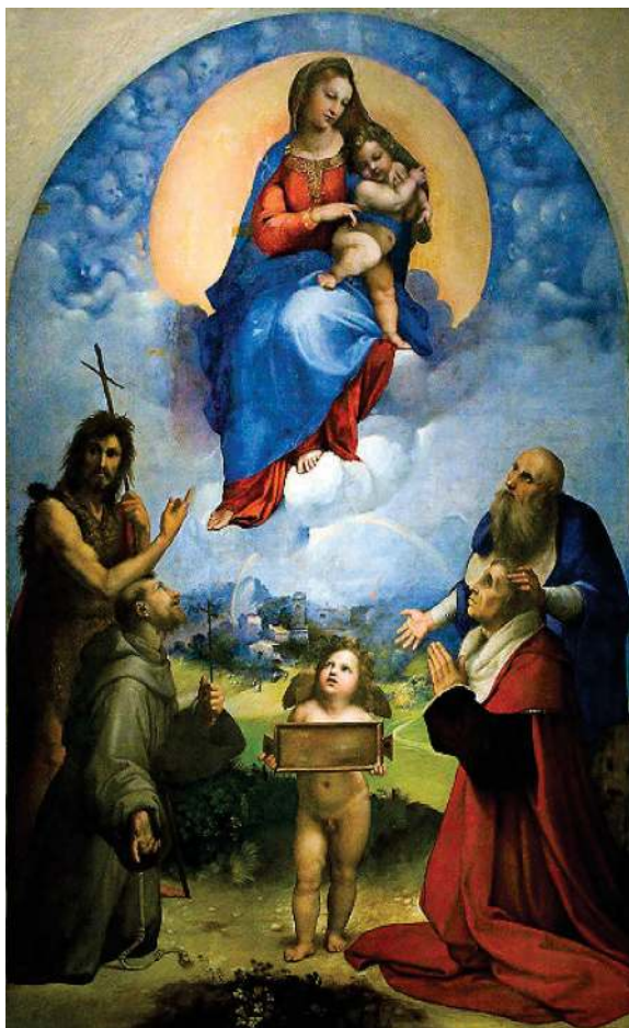
Figura 1. Madonna di Foligno de Raffaello Sanzio. Esta pintura (1511-1512) foi uma encomenda de Sigismondo de' Conti, secretário do papa Júlio II, para comemorar um milagre por sua casa ter sido preservada após ter sido atingida por um raio. Note que na parte superior do quadro se pode perceber o formato de um encéfalo (perfil direito). Curioso é o fato de Michelangelo ter pintado o afresco "A Criação de Adão" em 1511-1512 (Capela Sistina, Roma), onde também se percebe imagem de um encéfalo (perfil esquerdo)

Do ponto de vista artístico-estético, este gênero tem características marcantes da arte popular, destacando-se o anonimato, o tom sentimental e simbólico das obras e a simplificação de cores, volumes e formas. (1,9) A preocupação formal com a técnica está em segundo plano, e grande parte dos artistas conhecidos como "santeiros" ou "milagreiros" são artesãos locais com acesso restrito a tradicionais escolas de arte. (1) Entretanto, há exceções, com artistas que obtiveram sucesso e obras clássicas com rigor à norma estética, como por exemplo a Madonna di Foligno de Raffaello Sanzio (Figura 1).