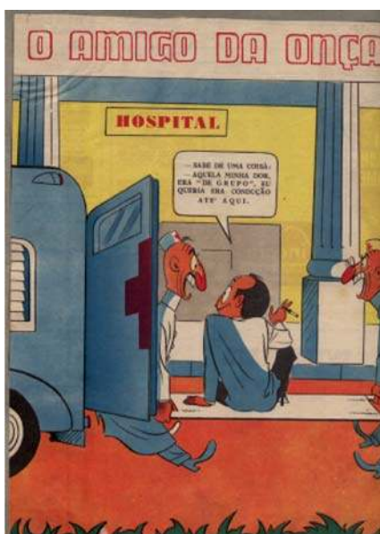
Figura 3. Personagem do artista Péricles de Andrade Maranhão. Sempre satírico, irônico e crítico, o personagem "O amigo da onça" aparecia desmascarando seus interlocutores ou colocando-os em situações embaraçosas.

Além do conteúdo sociopolítico, a caricatura dá ênfase a expressões e sentimentos exacerbados, usando formas modificadas do corpo humano, principalmente do rosto, bem como de animais, sempre com intuito de impressionar ou influenciar o grande público. (5)