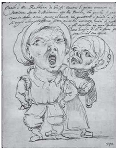
Figura 1. Desenho de Annibale Carracci retratando um casal de cantores italianos em 1600.

Relatos especulam que a caricatura já era utilizada por povos antigos como os egípcios, gregos e romanos. (2) Tais evidências têm sido encontradas em pinturas de vasos gregos, afrescos romanos em Pompéia e Herculano e em um papiro, no museu de Turim, que retrata o faraó Ramsés II com orelhas de burro. A primeira caricatura reconhecida como arte independente, hoje no museu de Estocolmo, data de 1600 e foi feita por Annibale Carracci, retratando um casal de cantores italianos. (2) (Figura 1).