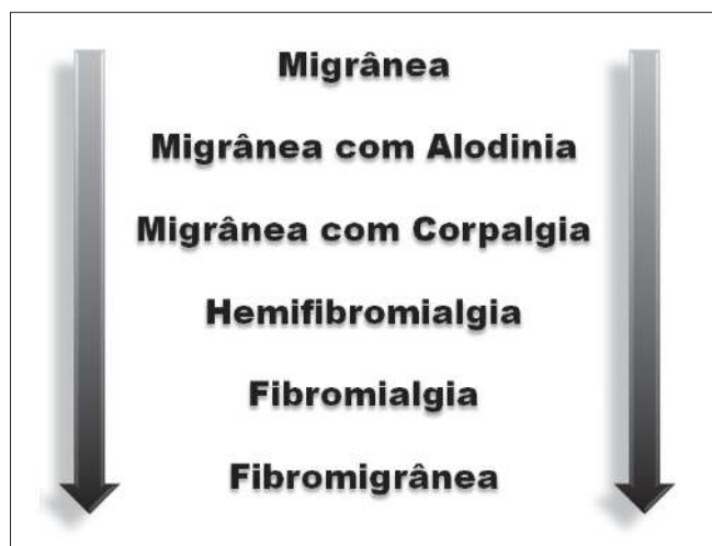
Figura 2. Espectro de progressão entre migrânea episódica e fibromigrânea.

Fibromialgia e migrânea compatilham características clínicas e demográficas, provavelmente havendo um mecanismo fisiopatológico comum para ambas, com disfunção no sistema nervoso central. A hipótese atual se apóia nas conhecidas anormalidades encontradas no processamento sensorial, principalmente no eixo hipotálamo-tronco cerebral. Diante do exposto, poderíamos começar a considerar a combinação das duas doenças – fibromigrânea – como uma condição clínica individual. Nós postulamos um espectro de progressão entre migrânea episódica, evoluindo para migrânea com alodinia, migrânea crônica, migrânea com corpálgia, hemifibromialgia, até fibromigrânea (Figura 2).